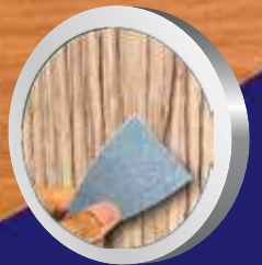
รอยตำหนิของไม้