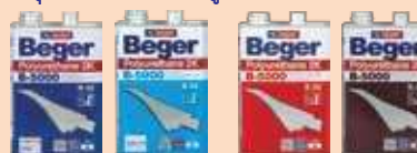
สำหรับภายใน สำหรับภายในที่สัมผัสแดด