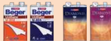
ยูนิเทน B-52 ไดมอนด์ โพลียูรีเทน