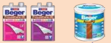
PI-5000 คัลเลอร์ ชนิดมิลิ โพลียูรีเทน สุตราบา อะควา พียู