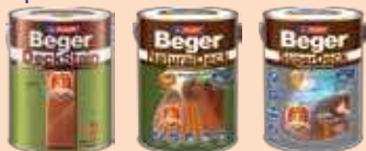
สีย้อมพื้นไม้เบเยอร์ เดคสแตน สีย้อมพื้นไม้เบเยอร์ เนเจอร์ริลเดค สีย้อมพื้นไม้เบเยอร์ ซูเปอร์เดค