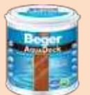
สีย้อมพื้นไม้สุตราบาเบเยอร์