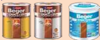
สีย้อมไม้เบเยอร์ ชนิดเงา สีย้อมไม้เบเยอร์ ชนิดกึ่งเงา สีย้อมไม้สุตราบาเบเยอร์