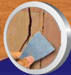
อุดรอยแตก ร่องไม้